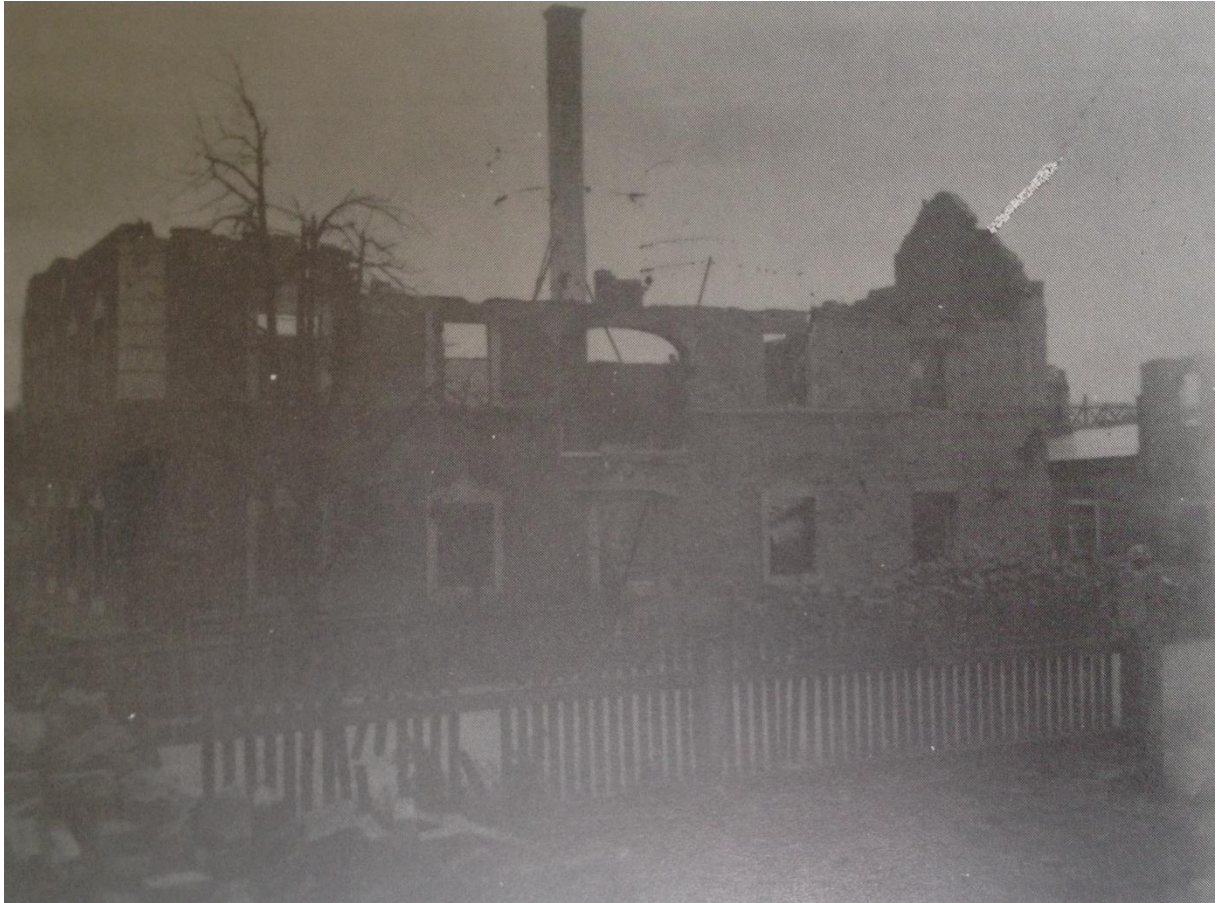
Das Anwesen Judenmann nach dem Angriff (Thalmassing. Eine Gemeinde des alten Landgerichts Haidau, S.99)